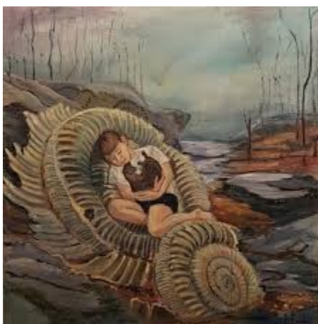
Olio su tela di Nicoletta Furlan